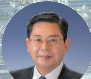
岐阜商工会議所 会頭