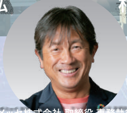
サンメッセ株式会社 取締役 専務執行役員