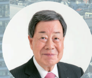
岐阜造園 代表取締役会長