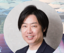
株式会社技研サービス 代表取締役社長