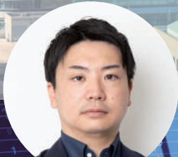
経営コンサルタント